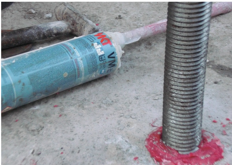
Photo no.: Hình mẫu 4 Subject: Hình ứng dụng Description: Khoan cấy bulông neo cầu thép vào bê tông bằng keo VME.

TAPCON CONSTRUCTION-TRADING TRUONG AN PHU CO., LTD.