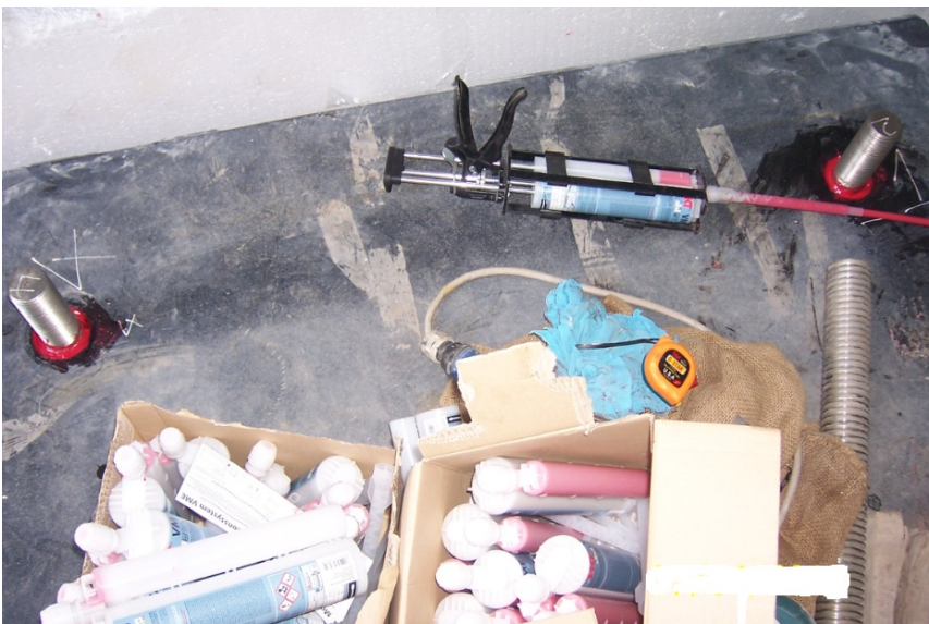
Photo no.: Hình mẫu 5 Subject: Hình ứng dụng Description: Khoan cấy bulông neo cầu thép vào bê tông bằng keo VME.

TAPCON CONSTRUCTION-TRADING TRUONG AN PHU CO., LTD.